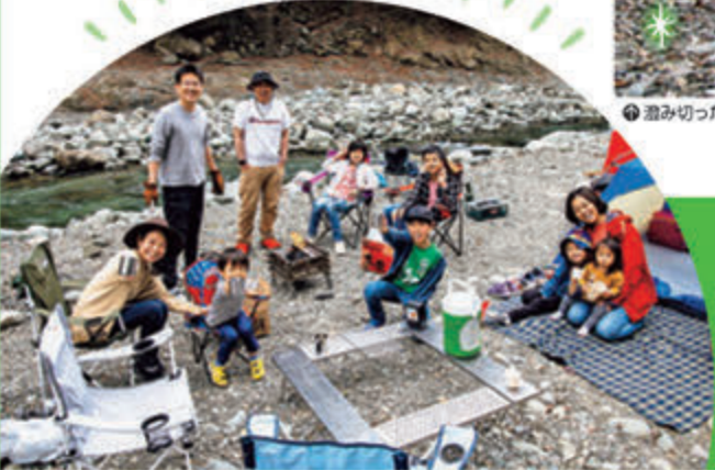
●2家族でやってきた皆さん「カンパ〜イ!今から楽しみます!」

●キャンプ入場料(4歳以上1名につき)300円 ●キャンプ大人700円、子ども(4歳~小学生)400円、テント1張(小)1800円、(大)2500円+駐車料1台700円 ●バーベキュー入場料(4歳以上1名につき)200円+駐車料1台500円