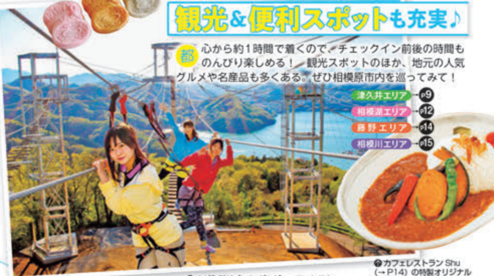
さがみ湖リゾート プレジャーフォレスト（→P10）の「絶叫吊り橋 風天」

心から約1時間で着くので、チェックイン前後の時間ものんびり楽しめる！観光スポットのほか、地元の人気グルメや名産品も多くある。ぜひ相模原市内を巡ってみて！