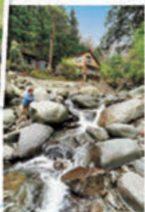
渓流での釣りが楽しめる此の滝沢渓流園（→P7）