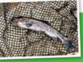
●川に漁られた釣堀ではニジマスの放流釣りやつかみ取りが楽しめる