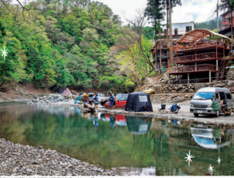
●澄み切った川的美しさに感動!後ろの建物が屋根付きバーベキュー場