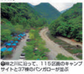
●神之川に沿って、115区画のキャンプサイトと37棟のバンガローが並ぶ

●看板犬のまめちゃんは、スタッフとお遊みのTシャツを着用 ●川遊びスポットとしてファミリーにも人気