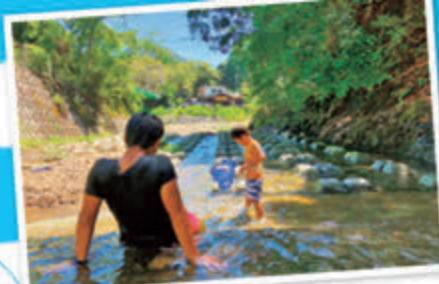
冒険心も芽生える川遊びを満喫しよう！青野原野呂ロッジ キャンプ場（→P5）