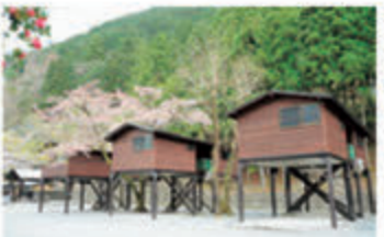
●高床式のバンガローは6畳で5名まで利用可能。1泊1万4300円

釣った魚は、グリルをレンタルして焼いて食べよう。魚の処理もスタッフが教えてくれるので安心。この日は女の子が魚の処理に挑戦していた