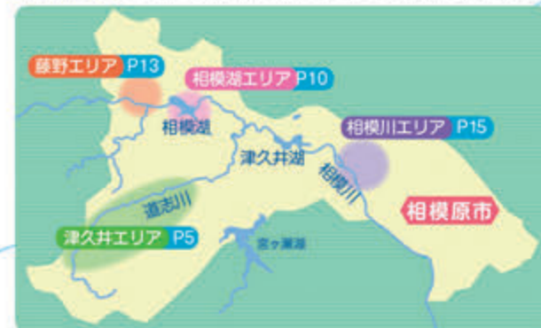
清流と木々の緑を満喫！青野原野呂ロッジキャンプ場（→P5）