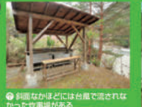
●斜面なかほどには台座で流された水が流れる