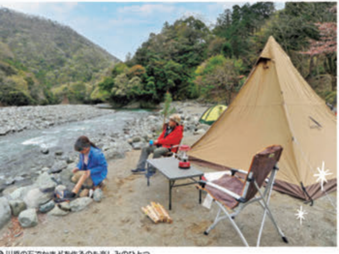
●川原の石でかまどを作るのも楽しみのひとつ