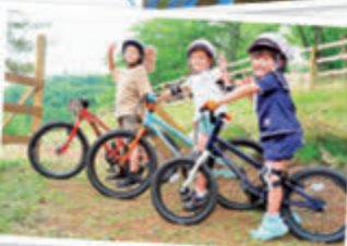
PICAさがみ湖（→P10）では、マウンテンバイクも楽しめる