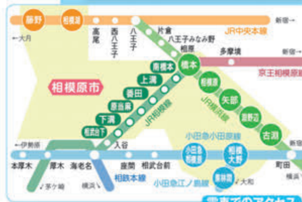
電車でのアクセス

相模原市のキャンプエリアはアクセスがよいのも魅力。東京から近いうえ、高速道路のインターや鉄道の駅がキャンプ場のそばにある。長距離の移動や渋滞がなく、余裕のあるプランでキャンプを満喫できる。