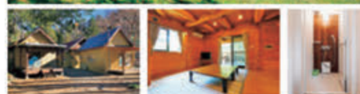
ファミリーにおすすめのバンガロータイプ。新戸キャンプ場（→P7）