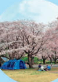
⑤ 満開の桜の下でキャン プができる市営上大 島キャンプ場(→ P15)