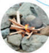
水辺なので、直火OKのキャンプ場もある。青久和キャンプ場（→P8）

道志川で川遊び！相模湖での遊覧ボート&フィッシング 関東最大級のバーベキューエリア！遊園地とのセットプラン…など