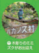
●本郷のミミズクがお出迎え