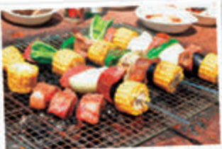
バーベキューは道具のレンタルも可能