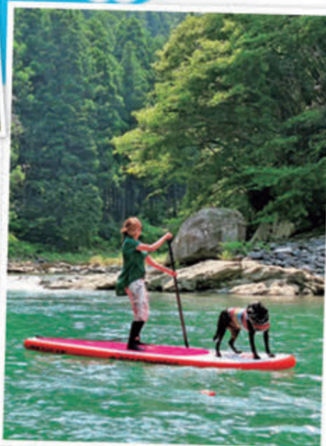
川でのSUPは気分爽快！青野原野呂ロッジ キャンプ場（→P5）