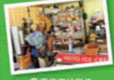
●売店では炭や薪、アルコール類、調味料なども販売