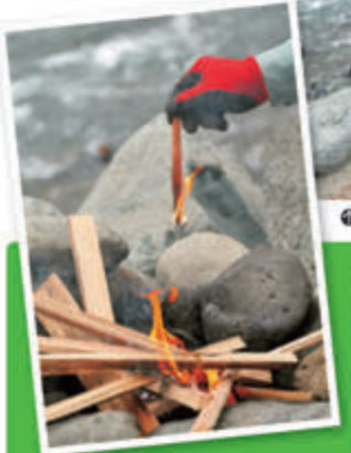
●篝火で焚き火ができるのも人気の秘密。川のせせらぎと炎に癒やされる