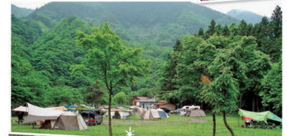
●山の緑と芝生の緑に包まれるキャンプサイト