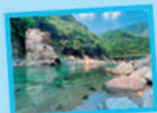
④ 澄んだ流れで川遊び! 青野原 野呂ロッジキャンプ場 (→ P5)