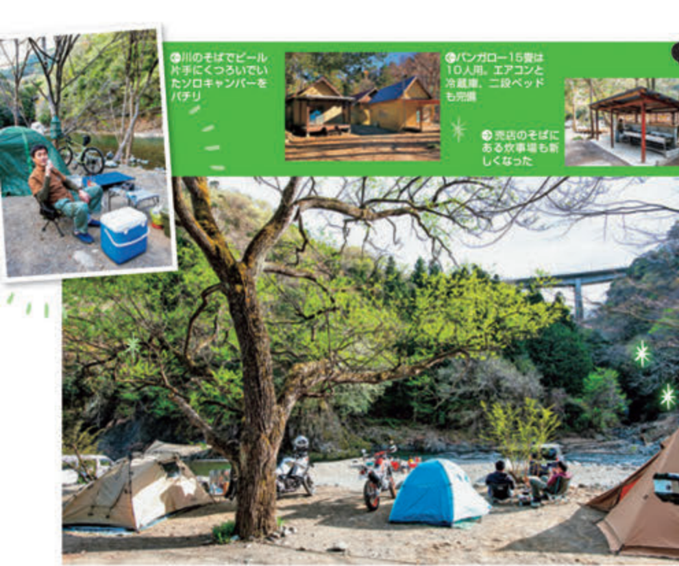
台風被害を逃れた木が多く残っているため、木陰でのキャンプも楽しめる