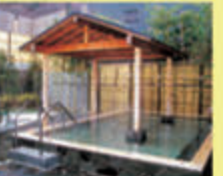
●源泉風呂、権風呂、岩風呂、露天風呂などがある

カルシウム・ナトリウム・硫酸塩泉でしっとりとなめらかな肌ざわり。入場制限などの情報はホームページで確認を。 ●10～21時(1・2月は～20時) ●火曜 ●大人750円、子ども(小学生)430円(いずれも3時間の料金)。12～2月の17時以降は割引あり