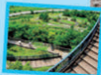
③ 市営上大島キャンプ場 (→ P15) に隣接する相 模川自然の村公園