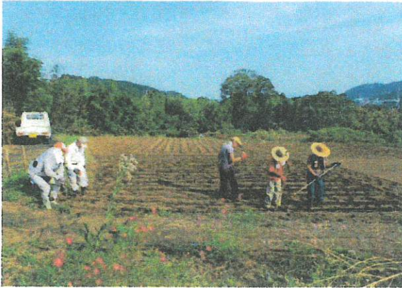
昨年10月5日 菜の花種まき