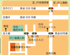
相模原市中央区田名1493-1 駐車場あり 土・日・祝日も営業

マリゴールドやニチニチソウなど定番の季節の花苗のほか、夏の暑さに強い種類も生産し、販売しています。リースづくりなど季節の講習会も人気です。一面に広がる季節の花苗の見学にぜひお立ち寄りください。