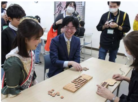
虎丸カップ相模原囲碁大会