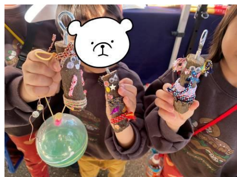
バードコールのワークショップ