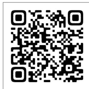
◀◀ こどもタウンニュース 「さがみはらロケ地巡りマップ」