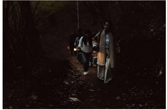
陣馬山ナイトウォーク