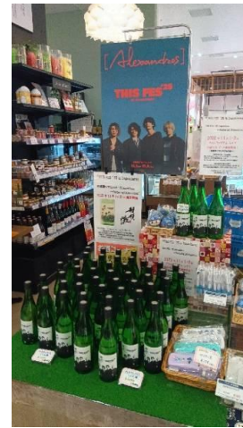
フェス限定ラベルの日本酒を数量限定販売