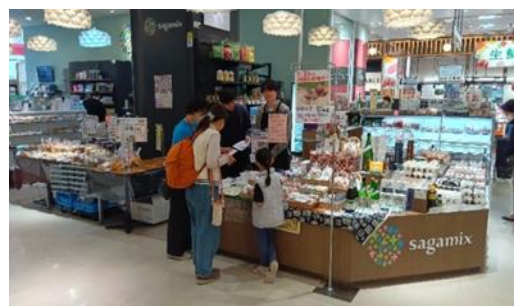
麻布大学ブルーベリー ハーブティー試飲会