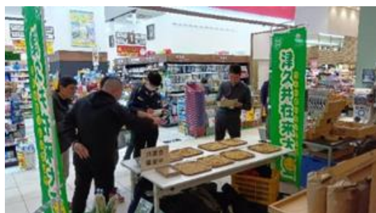
津久井在来大豆共進会

15. 3/7(土)青山学院大学ワイン「SORA」試飲販売会 (限定 100本/2,200円(税込))