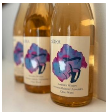
青山学院大学ワイン 「SORA」試飲販売会